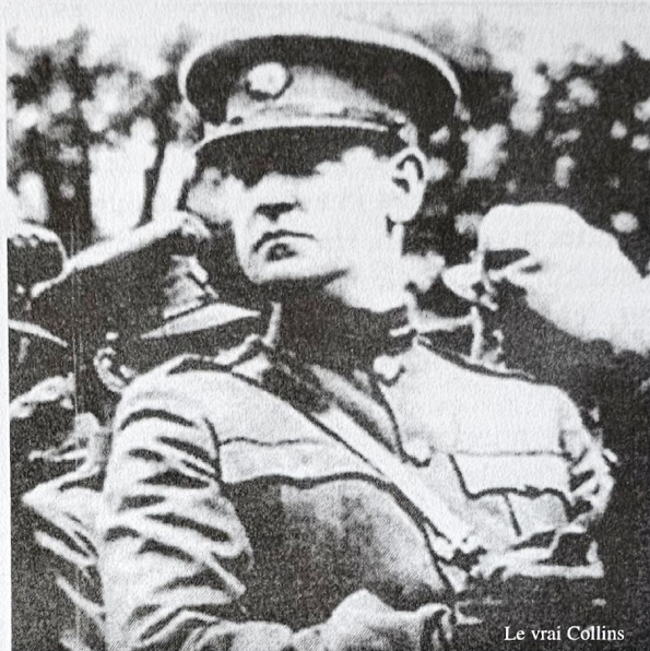
Le vrai Collins

Soixante-quinze ans après sa mort, Michael Collins reste un sujet de polémique, et plus encore depuis le film où Neil Jordan nous livre sa vision si particulière du rôle de "Big Fellow". Jusqu'au début des années 90, l'histoire officielle ignorait le rôle de Michael Collins en 1916-22. Il a fallu une biographie, basée sur les données des Archives Nationales et le film pour que se rouvre le débat et les tensions politiques.